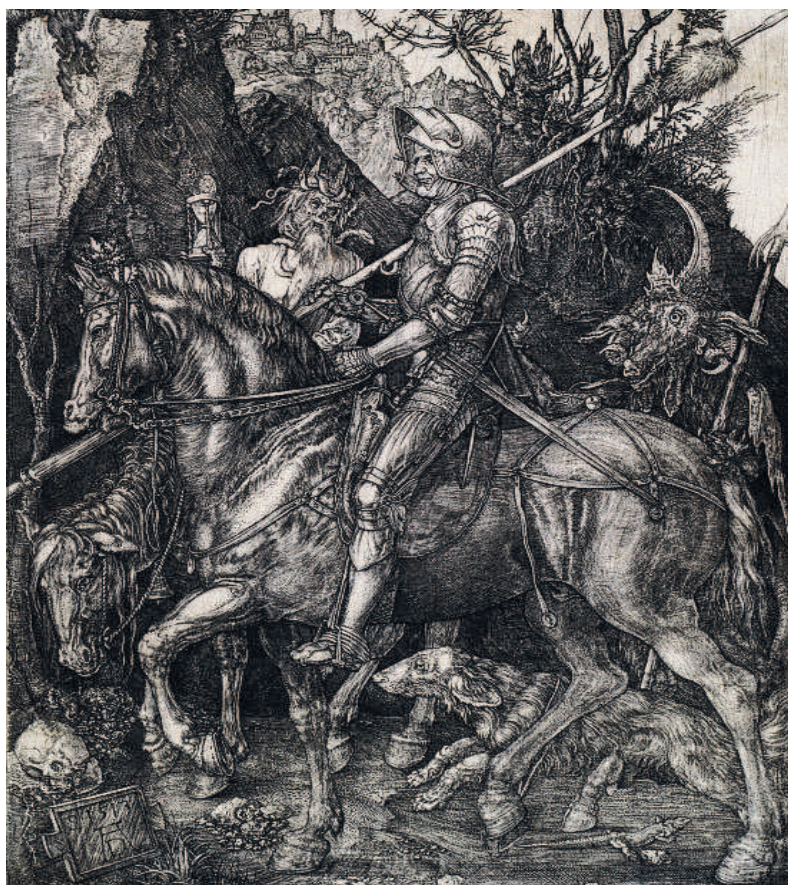
'El cavaller, la mort i el diable', gravat de l'alemany Albrecht Dürer (1513).

EL REIAL CERCLE ARTÍSTIC, EL MUSEU DIOCESÀ I LA CATEDRAL DE BARCELONA MOSTREN EL GRAN MESTRATGE COM A GRAVADOR DE L'ARTISTA DEL RENAISSAMENT ALEMANY ALBRECHT DÜRER